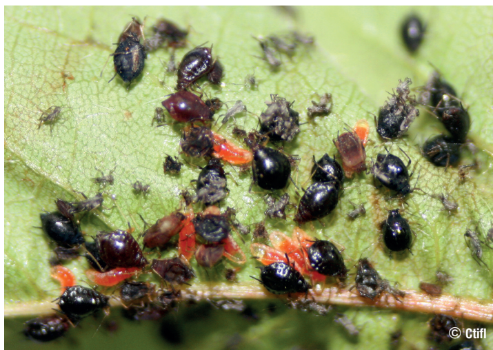
Larves d' Aphidoletes aphidimyza sur puceron noir du cerisier