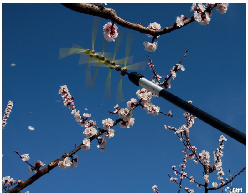
Brosse effleureuse pour éclaircissage mécanique

À noter que dans certaines situations l'éclaircissage manuel des fruits peut atteindre 250 à 300 h/ha en l'absence d'utilisation d'une technique d'éclaircissage sur fleurs ou sur très jeunes fruits.