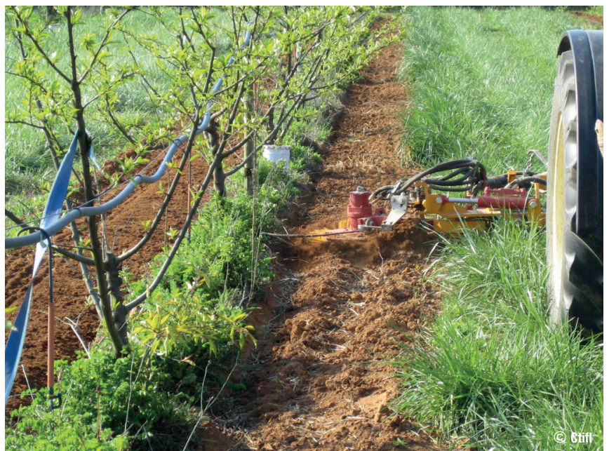
Entretien du sol selon le système sandwich