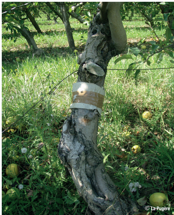
Pose de bandes pièges contre le carpocapse du pommier et du poirier

• Monographies par espèce fruitière : voir la rubrique « En savoir plus » de la => Fiche technique n° 6 : « Contrôle génétique »