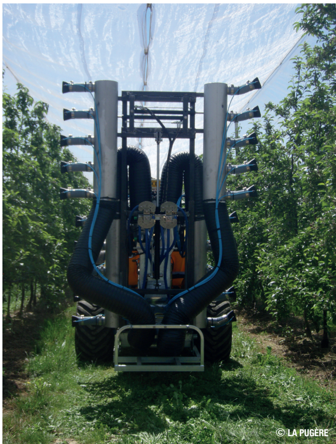
Pulvérisateur pneumatique à jet porté pour contrôle optimal des traitements

– Systèmes de traitement fixe sur frondaison : utilisation d'un réseau fixe d'irrigation pour l'application des produits phytopharmaceutiques sur la culture. Pulvérisation par aspersion sur frondaison à l'aide de micro-asperseurs situés au-dessus de chaque arbre. En étude au Ctifl et en stations régionales, mais ce mode d'application est non autorisé actuellement (contrairement aux pulvérisateurs en expérimentation ci-dessus).