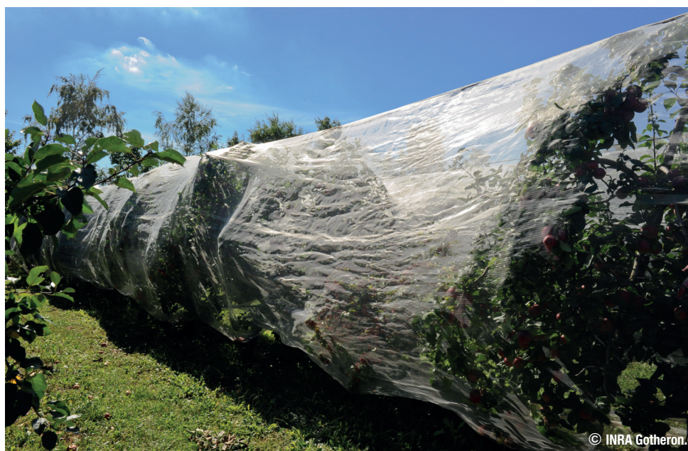
Filet Monorang Alt'Carpo sur rang de pommier dans la Drôme