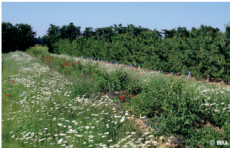
Bande fleurie en bordure de parcelle associée à une haie arbustive