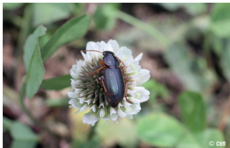
Carabe, prédateurs de pucerons, mouches, tordeuses et larves de carpocapse du pommier