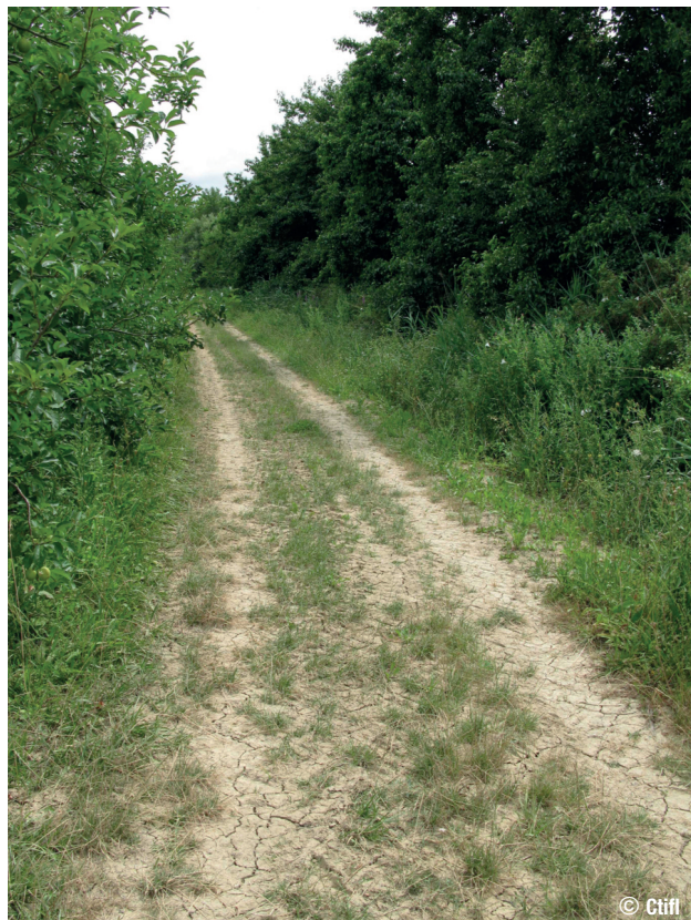
Extensification de l'entretien des abords