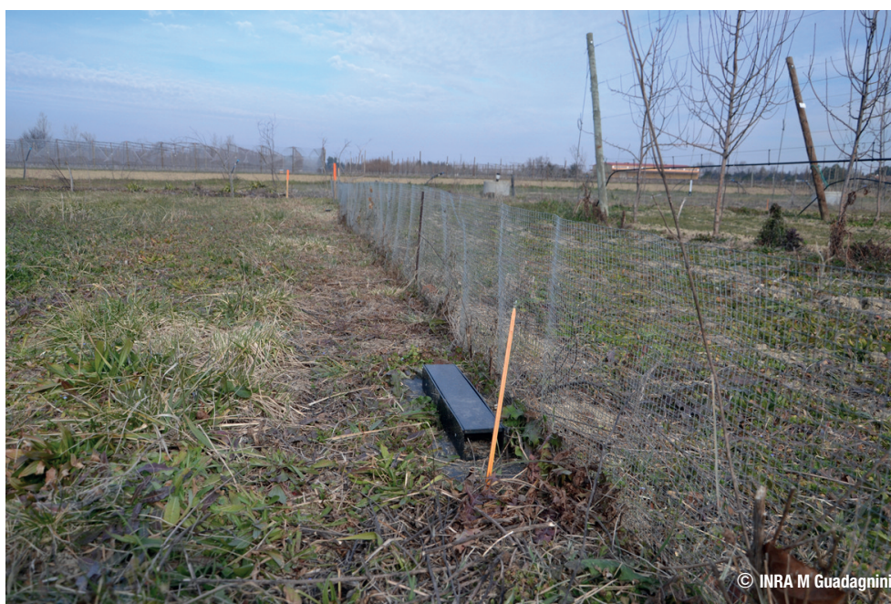
Grillage d'exclusion à campagnol avec piège autour d'un verger de pommier

Andermatt : http://shop.biocontrol.ch/webportal/showpage.asp?pagename=Biocontrol&ula=2