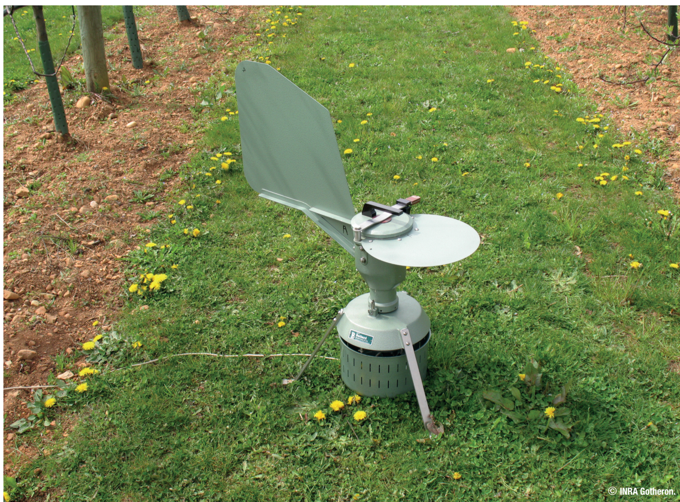
Piège à projections d'ascospores de Tavelure BURKARD ®

Chambre d'agriculture du Vaucluse et GDA Arboriculture de Vaucluse, 2014. Coûts des approvisionnements en arboriculture 2014. 27e édition. GDA, Cavailon, 212 p.