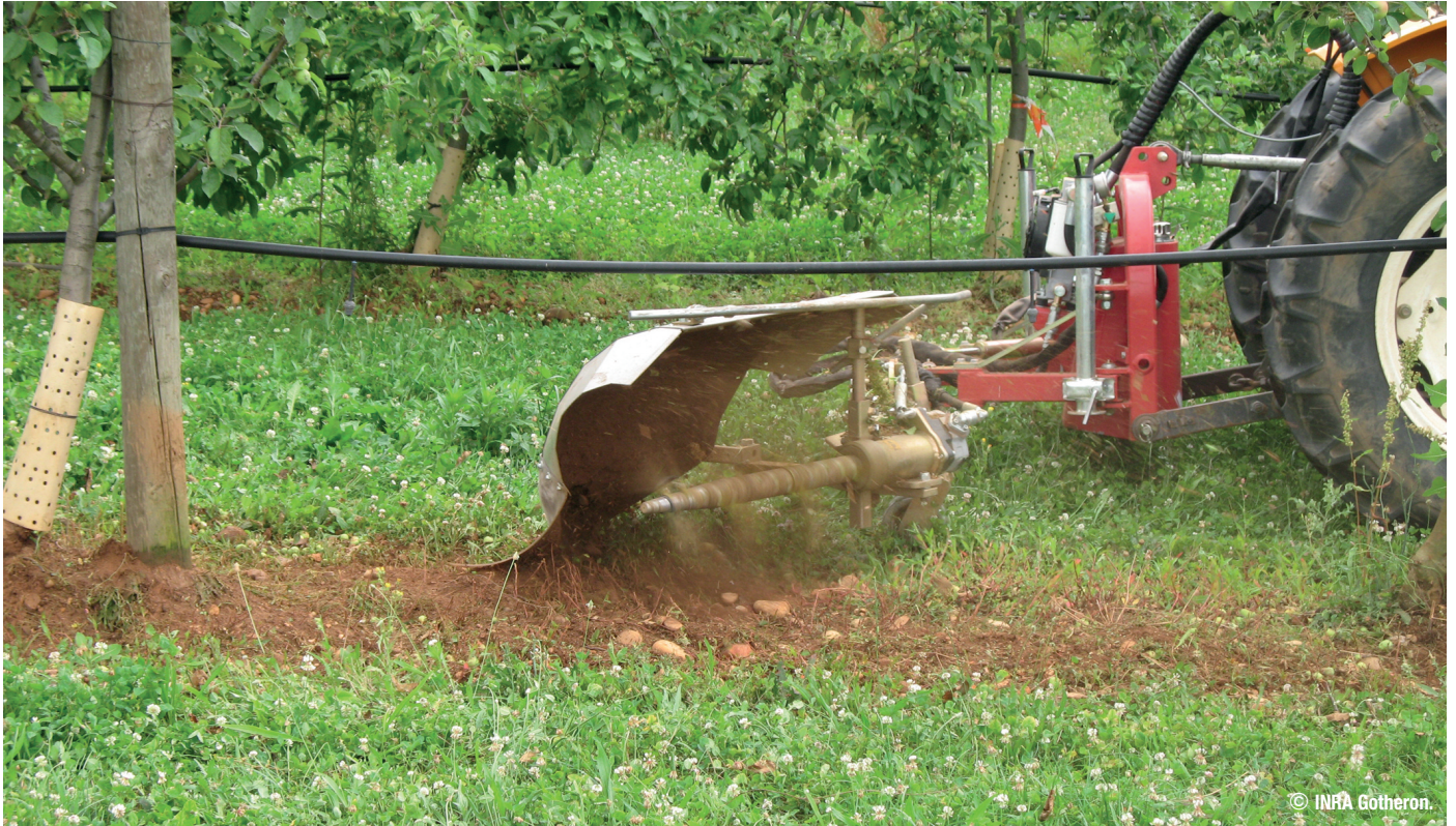
Désherbage mécanique à l'aide de l'outil Herbanette ®- Drôme