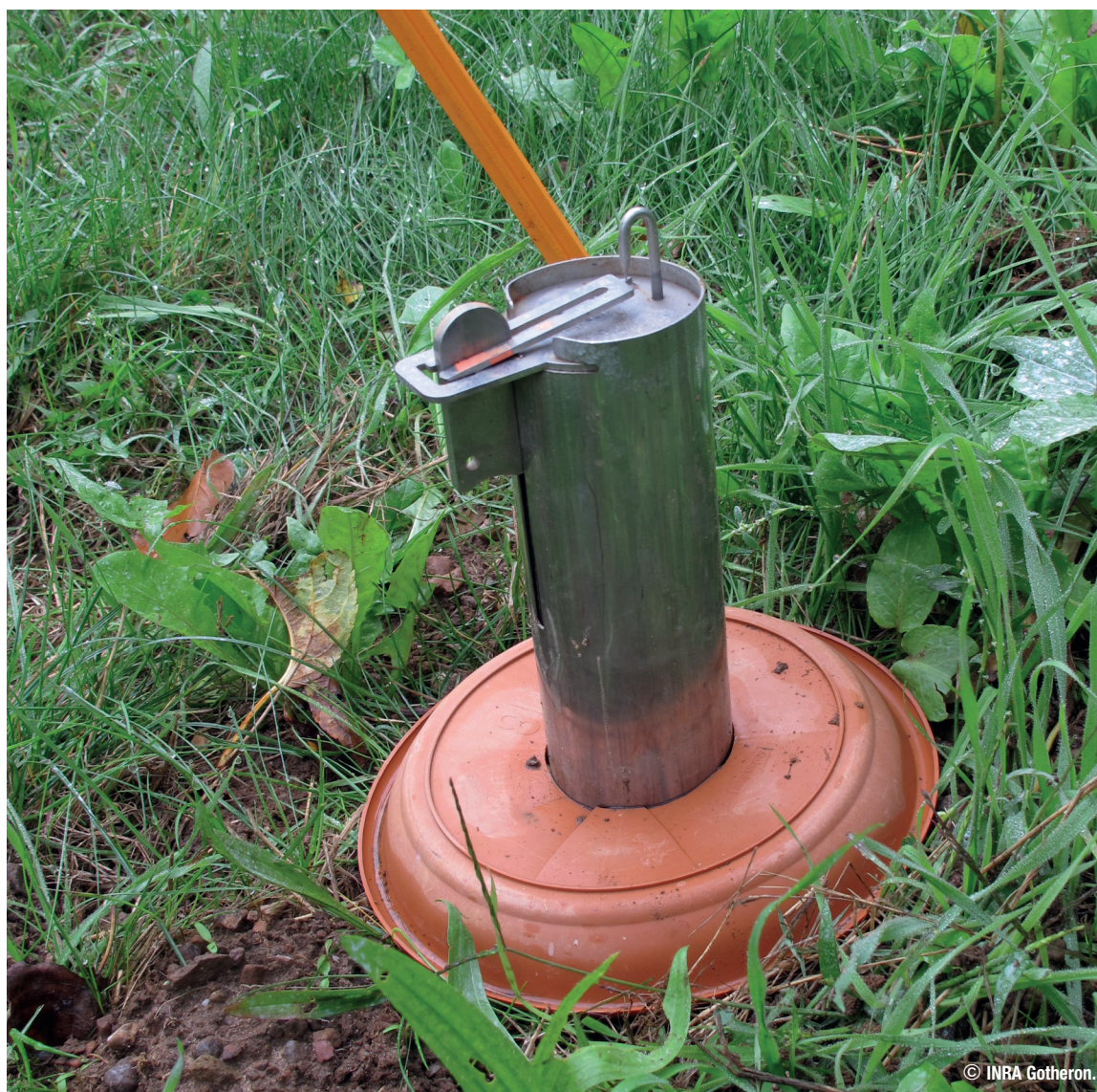
Piège à campagnols