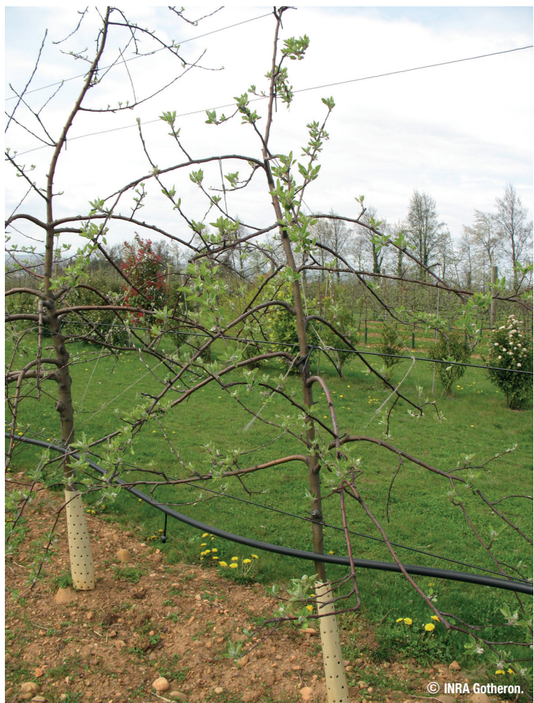
Manchon de protection sur pommier en verger Bio dans la Drôme

* Lutte collective organisée sous l'égide d'un organisme à vocation sanitaire (OVS) pour le domaine végétal : Fredon (Fédération régionale des groupements de défense contre les organismes nuisibles)