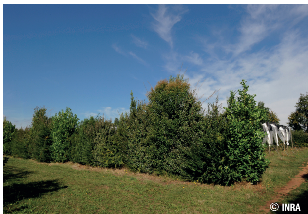
Haie verger dans la Drôme