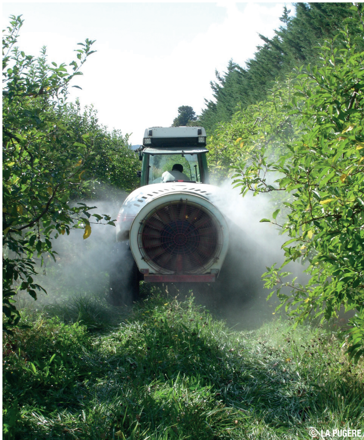
Pulvérisation de nématodes sur pommier