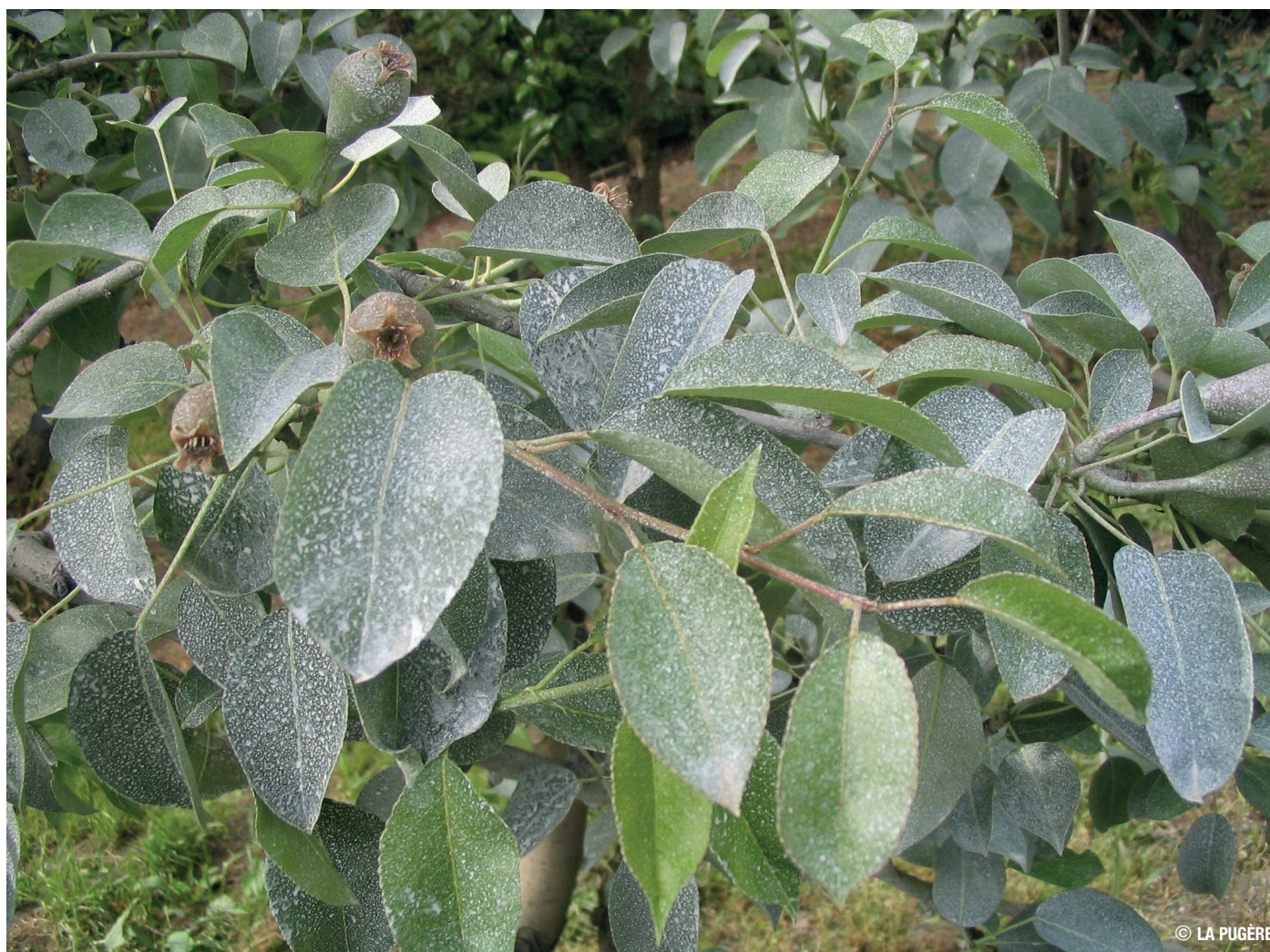
Pulvérisation d'argiles sur arbre pour lutter contre le Psylle du poirier

↳ Argical Pro® : http://www.ags-mineraux.com/Scopi/Group/AGS/ags-mineraux.nsf/pagesref/SLMM-8BHM37/$File/METAKAOLINS%20AGS.pdf