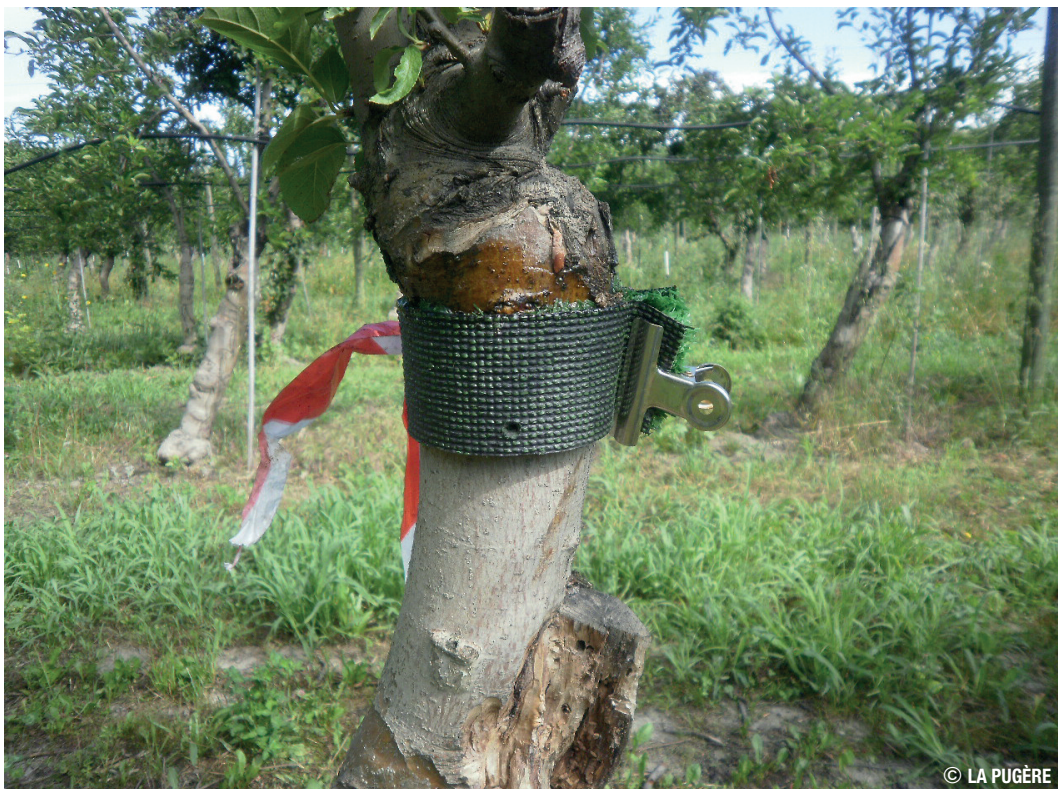
Bande de Glu posée sur le tronc du pommier

On utilise une pâte de chancre hypovirulent, correspondant à un amas de souches de champignons vivants contaminés par un virus Cryphonectria , pour lutter contre le chancre de l'écorce sur châtaignier.