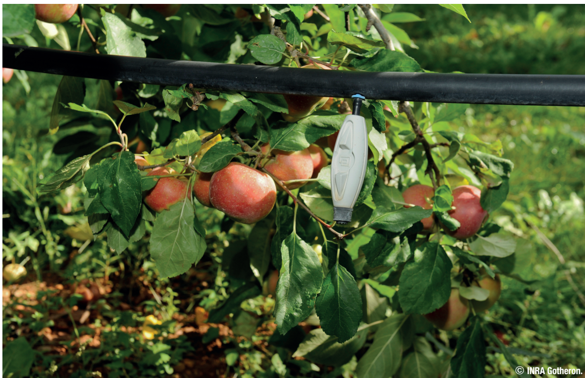
Système d'irrigation à aspersion dans un verger de pommier

Si l'enjeu est de mobiliser toutes ces connaissances récentes, la difficulté réside dans la recherche d'un compromis entre une nutrition hydrominérale suffisamment sous contrainte pour réduire significativement la sensibilité des arbres aux bio-agresseurs et un état nutritionnel suffisant pour obtenir les performances agromonomiques visées.