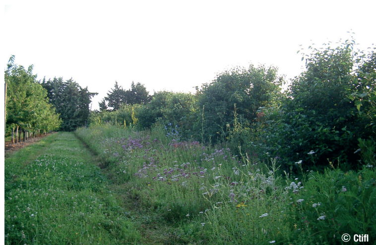
Bande fleurie en bordure de verger