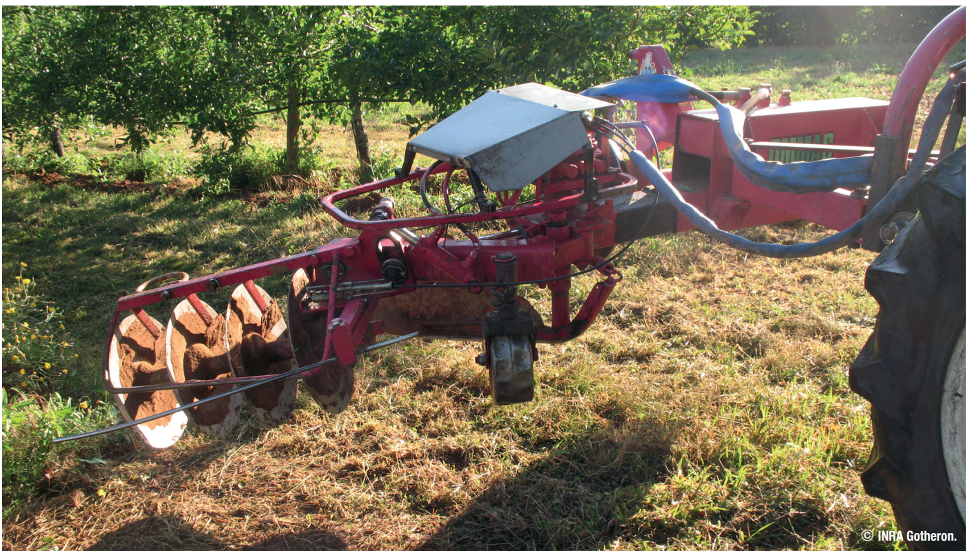
Outil de désherbage mécanique Ommas ®