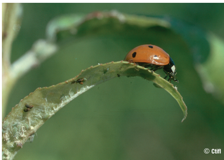
Coccinella septempunctata sur puceron farineux du pêcher