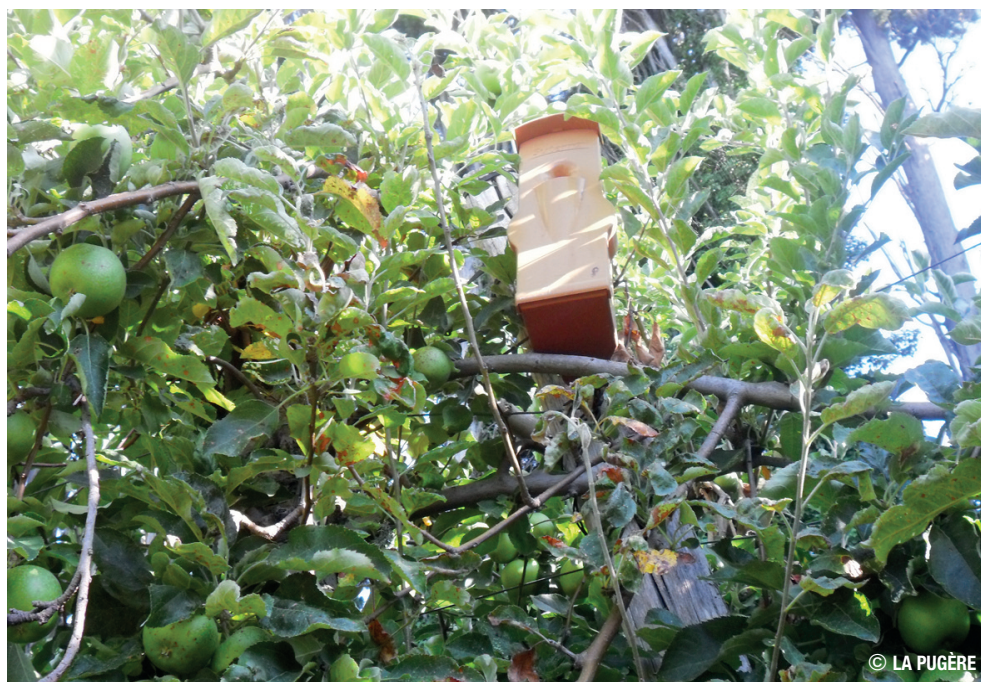
Diffuseur de phéromone Isomat® pour lutter contre le carpocapse