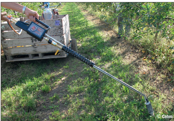
Système à explosion permettant de détruire les galeries de campagnols