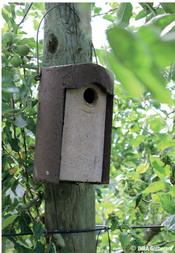
Nichoires à oiseau dans verger de pommier