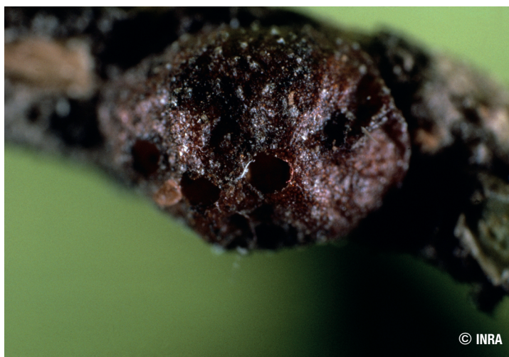
Prédation de Metaphycus bartletti sur la cochenille noire de l'olivier