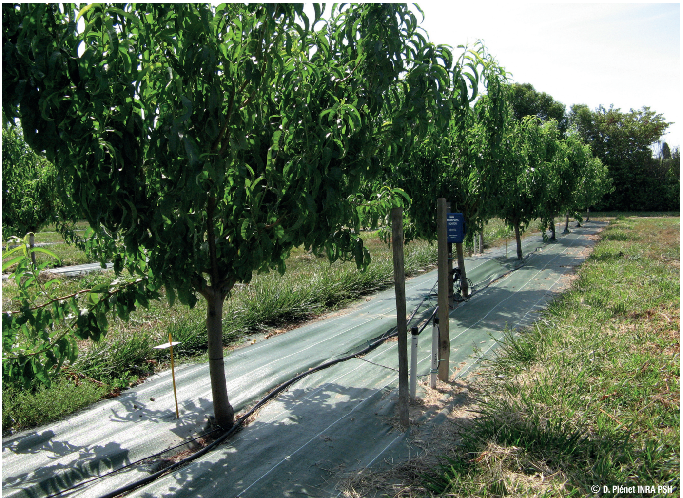
Paillage sur rang d'un verger de pêcher